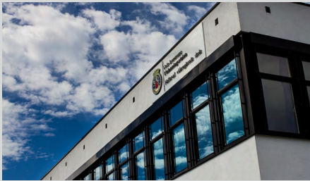
בתי ספר באוסלו (98 מערכות) אוסלו, נורבגיה

אתם מוזמנים לבקר באתר סטנטופון ישראל www.stentofon.co.il - למידע נוסף על הפרויקטים שלנו ולצפייה בפרויקטים נוספים של Vingtor-Stentofon.