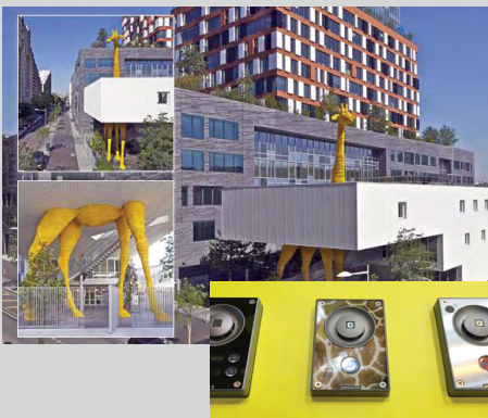
CRÈCHE DE LA GIRAFFE בולון בילנקורט צרפת

גן ילדים עם פאנלי אינטרקום מותאמים אישית. הפתרון שניתן: אינטרקום וידאו לזיהוי מבקרים לא מורשים, תמיכה בלולאת השראה, לוח מקשים עם כתב ברייל, סריקת שמע, תקשורת פנימית, אפשרות לצפייה בנעשה בגן בשלט רחוק, ניהול מקומי, ניהול מרחוק.